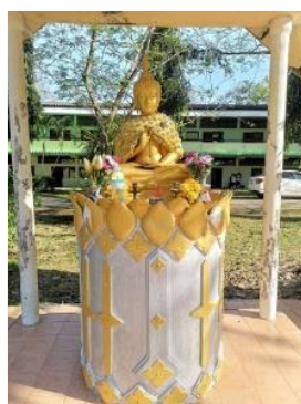
“พระพุทธรูปปางปฐมเทศนา”