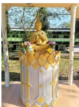
“พระพุทธรูปปางปฐมเทศนา”