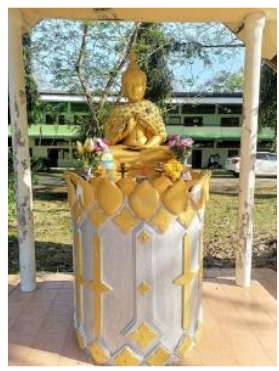
“พระพุทธรูปปางปฐมเทศนา”